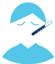
Jaarlijks gemiddeld verzuimpercentage van 2011 t/m 2021